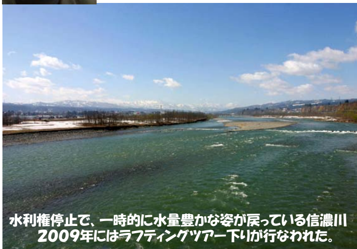
水利権停止で、一時的に水量豊かな姿が戻っている信濃川 2009年にはラフティングツアー下りが行なわれた。

NPO 法人新潟水辺の会代表、水郷水都全国会議共同代表、映画『阿賀に生きる』制作などに取り組む。主な著書に、『利根川治水の変遷と水害』(東京大学出版会)、『洪水と治水の河川史』(平凡社)、『川がつくった川、人がつくった川』(ポプラ社)、『技術にも自治がある』(農文協)、共著に『日本のダムを考える』(岩波ブックレット)、『ローカルな思想を創る』(農文協)などがある。