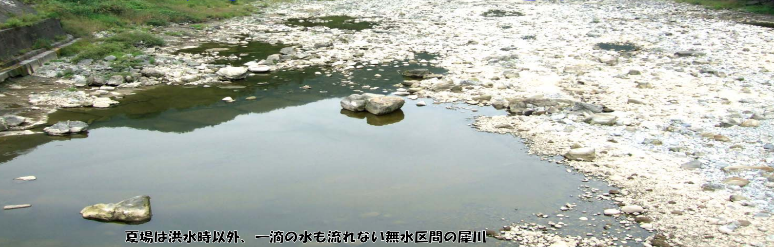
夏場は洪水時以外、一滴の水も流れない無水区間の犀川

信濃川は、長野県から新潟県を流れ、日本海へ注ぎ、長さ367km、流域面積11,900km 2 、年間流量約160億m 3 を有する、日本を代表する大河です