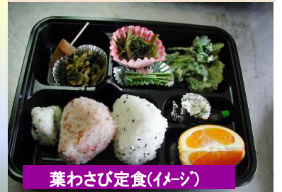
葉わさび定食(イメージ)