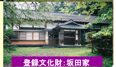
登録文化財：坂田家