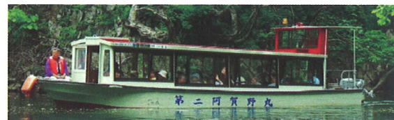
山形県長井ダム湖で実施している自然観察ツアー(阿賀の里)