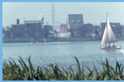
撮影: 小林 昭栄氏 (新潟市清五郎) 昭和30年~40年代

操船は阿賀の里のベテラン船長が安全運行基準で実施いたします。天候などの条件により中止・休止の場合がございます。