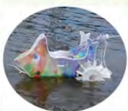
水質浄化ロボ ガタッチョ