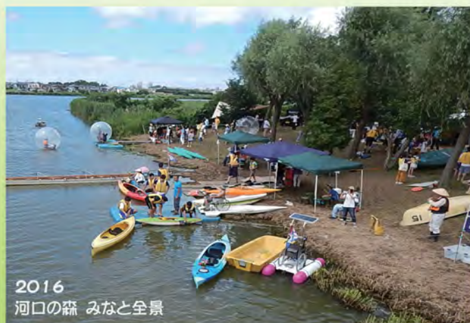
2016 河口の森 みなと全景