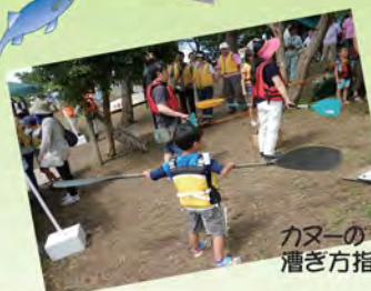
カヌーの 漕ぎ方指導