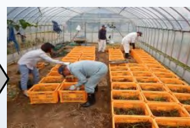
ハウスで苗の生育管理