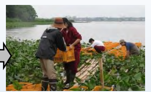
赤塚中學生も参加で筏に設置