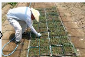
空芯菜の苗づくり