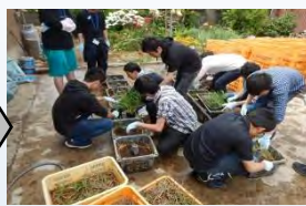
ABio 学生さんの植付協力