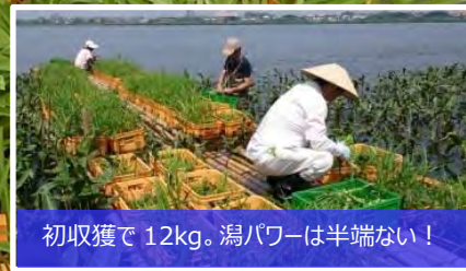
初収穫で12kg。潟パワーは半端ない!