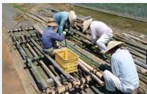
竹林間引き竹で筏づくり