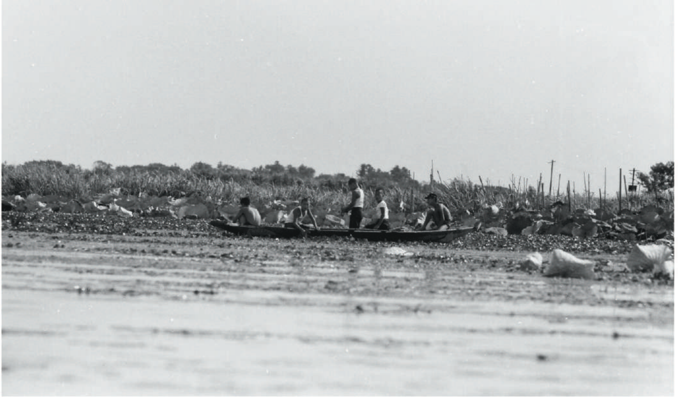
舟に乗る少年達